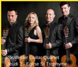
Rössfelder Guitar Quartet Jeudi 2 - Eglise St Trophyme